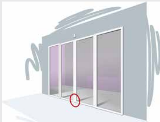
1. Zestaw podstawowy

Specjalna blokada wypadania zmniejsza ryzyko sforsowania skrzydeł drzwi ręcznie lub łomem.